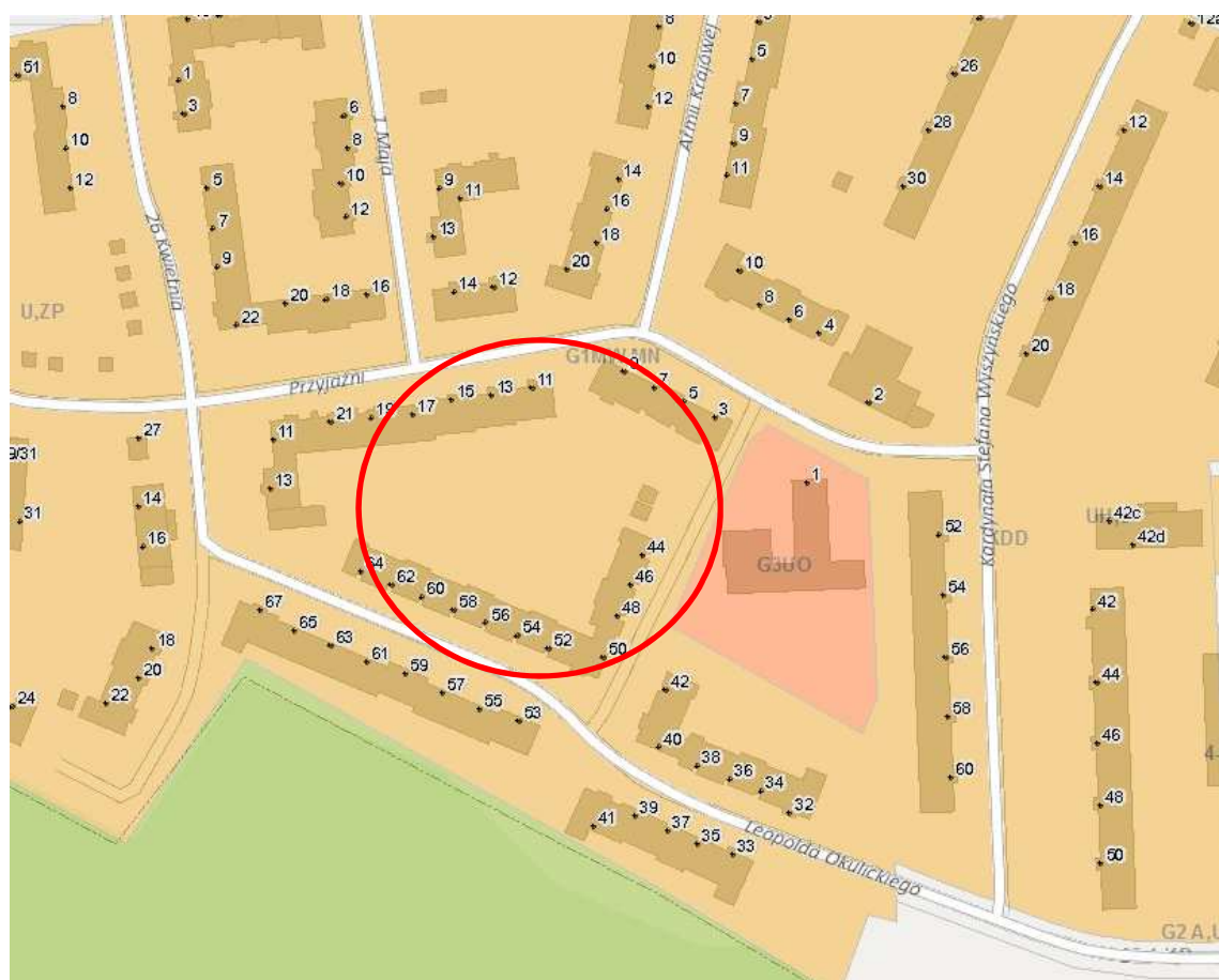
Rys. Plan Zagospodarowania Przestrzennego

Planowane przedsięwzięcie ma na celu opracowanie projektu budowlanego dla wykonania nawierzchni drogi wewnętrznej oraz budowy miejsc postojowych wraz z przestawieniem istniejących śmietników – w miejsca wskazane na planie sytuacyjnym oraz usytuowanie 4 szt. śmietników typu molok.